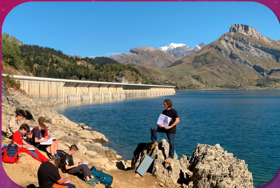
Lecture de paysage au bord de la Mer Alpine – Roselend, Beaufortain (73)